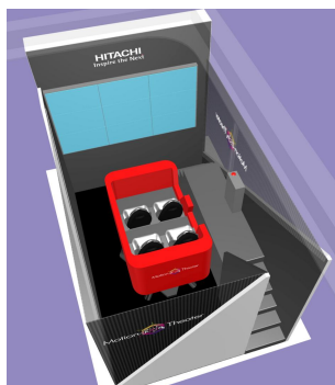
动态模拟剧场（示意图）

在 4 人乘坐的动态模拟剧场，观众可参与外界识别、制动、悬架等行驶安全技术以及运用电动汽车充电管理等信息通信技术的车辆行驶模拟体验。