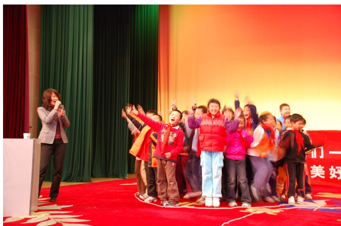
■ 同学们积极参与活动

日立表示今后将把此项活动继续下去。孩子是中国未来，日立希望通过此活动，能够让同学们从小就了解环保知识，并能够积极的参与进来。