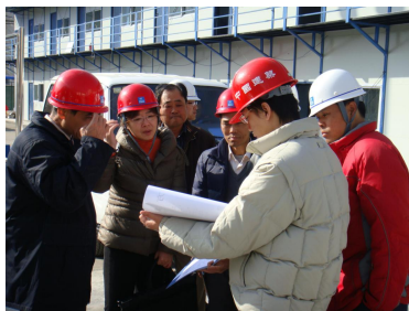
■日立电梯领导到工地考察