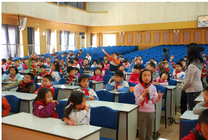
■ 同学们踊跃回答问题