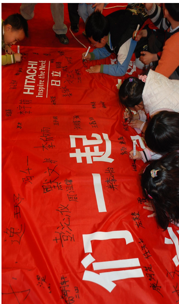
■ 同学们在横幅上签名