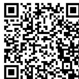
云上展厅日立集团展区