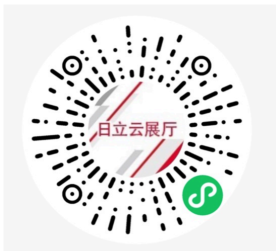
2020 工博会日立云展厅

中国国际工业博览会是由工业和信息化部、国家发展和改革委员会、商务部、科学技术部、中国科学院、中国工程院、中国国际贸易促进委员会、联合国工业发展组织和上海市人民政府共同主办。本次第 22 届中国国际工业博览会规划展示面积达 30 万平方米，参展企业超过 2000 多家。作为今年疫情防控常态化之下举办的首个国家级工业展会，今年工博会采取“线下为主、线上为辅”的会展新模式，实现线上线下有机融合办展。通过微信小程序“2020 工博会日立云展厅”，即可线上浏览本次日立展出的相关内容。