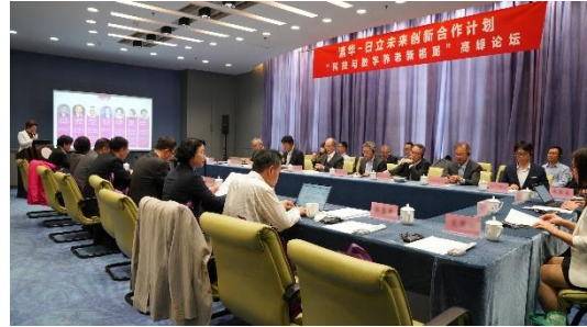
白皮书发布现场照片

近日，日立和清华大学共同举办了智慧养老高峰论坛，并在论坛上联合发布了合作研究成果：《中老年健康科技产品可持续使用白皮书》（以下简称：白皮书）和指导设计实践的《中老年科技产品可持续使用设计指南》（以下简称：设计指南）。