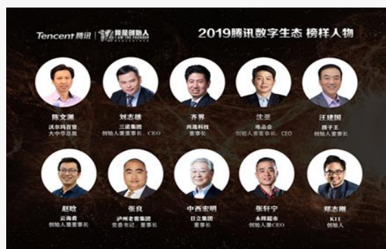
2019腾讯数字生态 榜样人物

2018年9月，日立与腾讯签署战略合作意向书，就IoT物联网关联业务领域建立起了长期合作关系。目前，日立集团正携手腾讯云及腾讯微瓴就物联网操作系统在智慧城市、智能楼宇领域的深入合作进行探讨，一方面腾讯发挥其在腾讯云等国内物联网操作系统方面的领先技术优势，另一方面日立集团在IT（信息技术）及OT（控制技术）领域深耕多年，也可发挥自身在智慧城市、智慧楼宇项目中的顶层规划设计经验，同时在电梯、空调、生物识别等产品、技术层面，支持与腾讯微瓴等物联网操作系统的无缝技术对接。此外，在健康养老、智能制造、智慧物流、企业微信应用等方面，双方也正在开展进一步的技术交流与合作探讨。